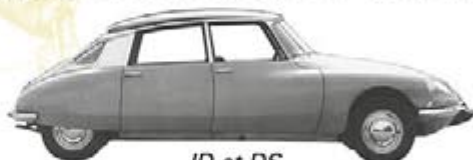
ID et DS

Pièces d'entretien et accessoires pour véhicules anciens.