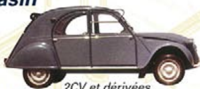
2CV et dérivées

Expéditions quotidiennes en France et à l'étranger ou enlèvement en magasin.